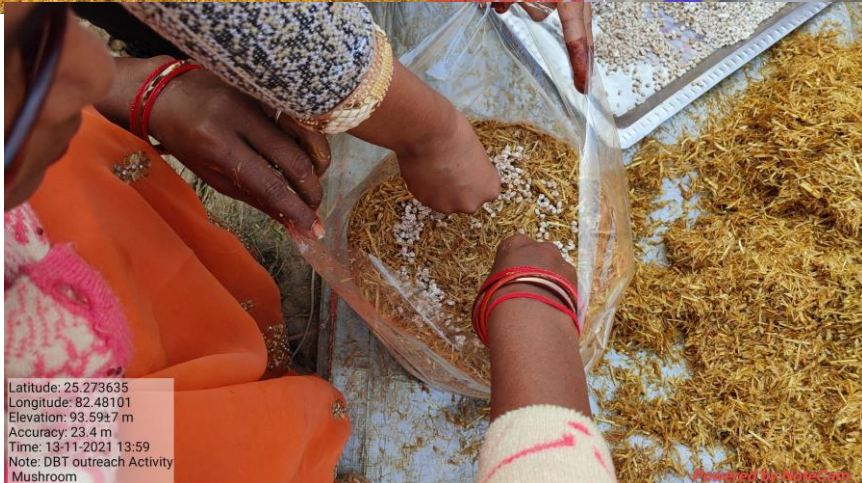
Latitude: 25.273635 Longitude: 82.48101 Elevation: 93.59±7 m Accuracy: 23.4 m Time: 13-11-2021 13:59 Note: DBT outreach Activity Mushroom