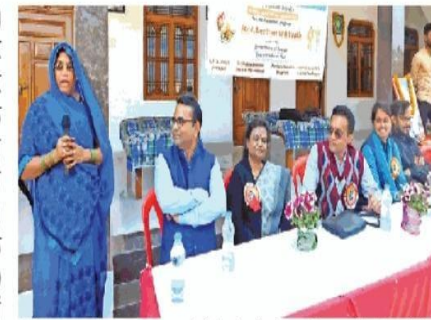
गोपीपुर में आयोजित जागरूकता गोष्ठी में बोलती महिला और मंचासीन केएनपीजी के