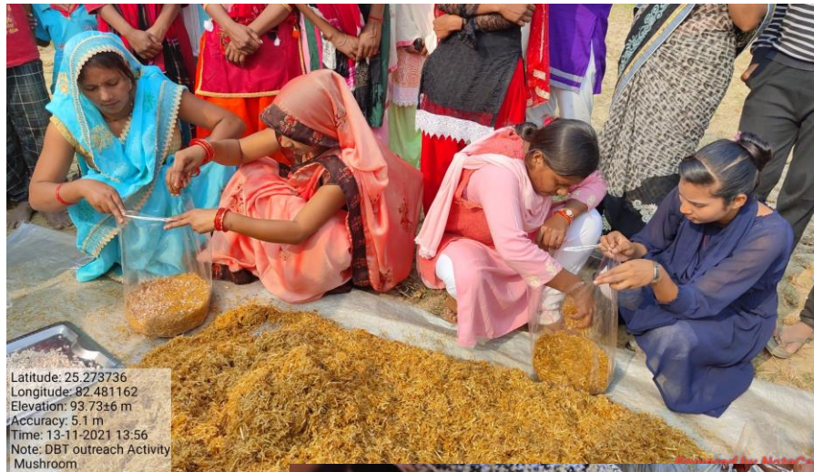
Latitude: 25.273736 Longitude: 82.481162 Elevation: 93.73±6 m Accuracy: 5.1 m Time: 13-11-2021 13:56 Note: DBT outreach Activity Mushroom