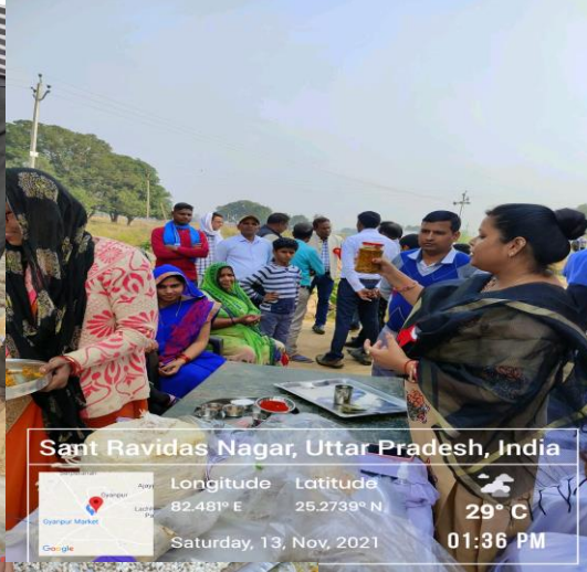
Sant Ravidas Nagar, Uttar Pradesh, India Longitude: 82.481° E Latitude: 25.2738° N 29° C Saturday, 13, Nov, 2021 01:36 PM