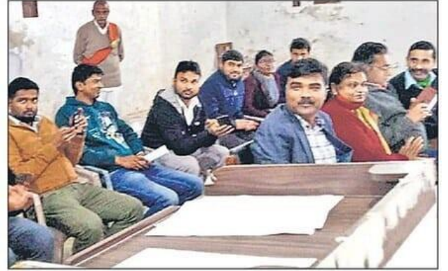
केएनपीजी कालेज में कैम्पस प्लेसमेंट कार्यक्रम में मंचासीन शिक्षक।