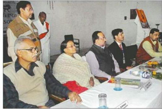
केएनपीजी कॉलेज में मुख्यमंत्री को आयोजित स्टार्टअप मेक इन इंडिया कार्यशाला में मंचासीन प्रतिधि।

अमर उजाला व्यूरे ज्ञानपुर। केंद्र सरकार की महत्वकांक्षी योजना स्टार्टअप मेक इन इंडिया का मकसद देश को रोजगार के अवसर शुरू करने को लेकर नए उद्यम शुरू करने को लेकर किया युवाओं का राका समाधान